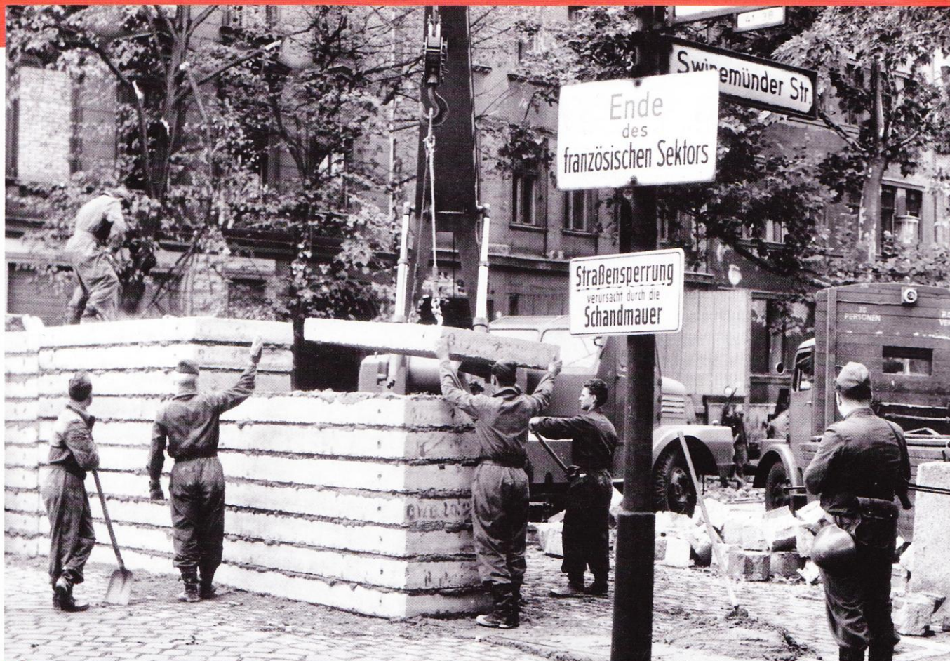
4 La construction du mur de Berlin en 1961.