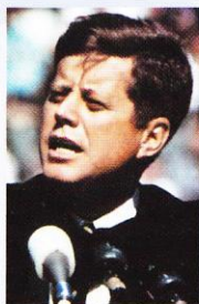
John Fitzgerald Kennedy (1917-1963)